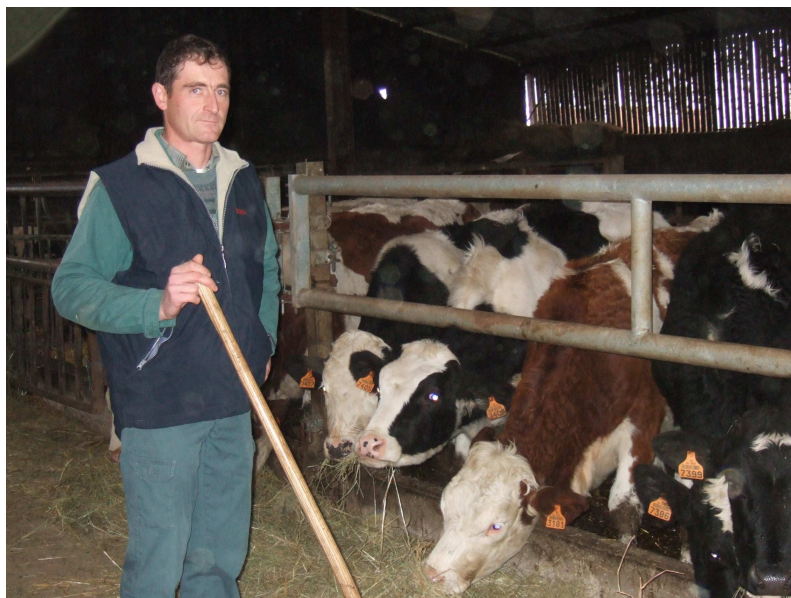
« En 2009-2010, les éleveurs laitiers ont dû faire face à une crise sans précédent »

La campagne catastrophique 2009-2010 n'a pas détourné les éleveurs laitiers de leurs objectifs à long terme. Dans un contexte de crise, ils ont su une nouvelle fois mettre en œuvre rapidement des mesures susceptibles d'en atténuer l'impact économique. L'expérience de cette crise devrait amener les éleveurs à plus de prudence dans les investissements et plus de sécurité au niveau des trésoreries. Mais la pérennité de l'activité laitière nécessitera le retour rapide à des prix du lait plus rémunérateurs.