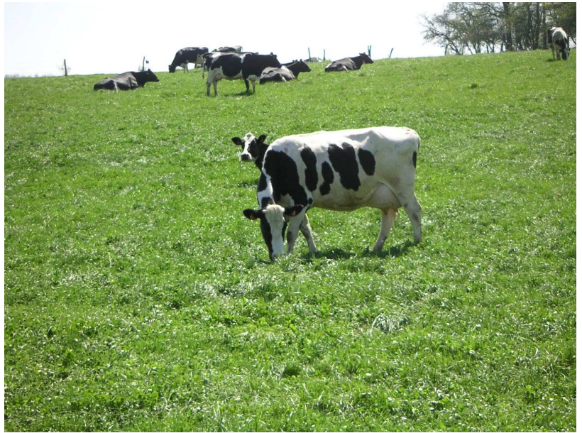
la production laitière valorise toujours bien les prairies

La vente de foin bottelé à 75 €/t se situe bien, juste entre les vaches allaitantes non primées et les bœufs prim'holstein 36 mois. Avec une faible charge de travail, cela pourrait tenter certains éleveurs. Mais est-il bien prudent de bâtir un système sur la vente de foin ? En effet, à l'avenir, excepté en année de sécheresse, l'offre sera nettement supérieure à la demande. Les éleveurs concernés risquent alors tout simplement de ne pas trouver à le vendre et se retrouver dans la situation initiale de sous valorisation de l'herbe.